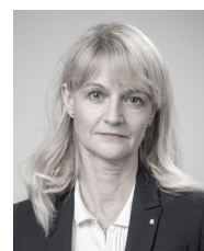
Charlotte von Essen